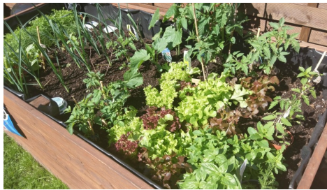
Anschaffung von Hochbeeten inkl. Jährlicher Finanzierung der Erde und Sämlinge