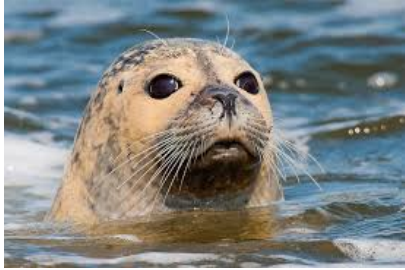
Besuch von der Schutzstation Wattenmeer